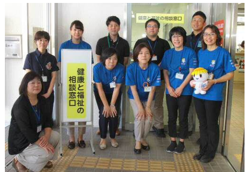
「健康と福祉の相談窓口」に常駐する職員

<問合せ> 健康に関すること 電話 0565-41-3081 福祉に関すること 電話 0565-41-3082