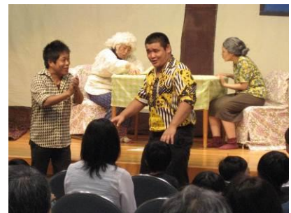
笑劇派から防犯の心得を楽しく学ぶ参加者

演目は猿投地域でも発生している住宅の侵入盗や、最近の特殊詐欺の手口と被害から身を守る方法、防犯ブザーの使い方や連れ去られそうになったときの対処方法などで、笑劇派が迫真の演技で参加者に防犯の心得を訴えました。