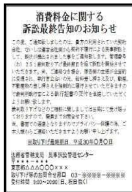
架空料金請求ハガキ

右のようなハガキ・メールに記載の電話番号には、 絶対に連絡しない!! 一人で判断せず誰かに相談を!!