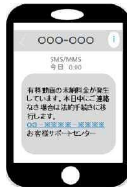
架空料金請求メール