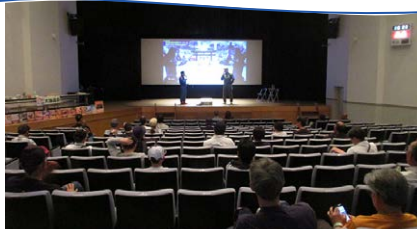
パブリックビューイング