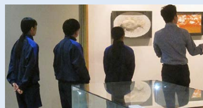
美術館で説明を聞く中学生

小原中学校2年生2人が、小原和紙のふるさと和紙工芸体験館に職場体験にやってきました。豊田市役所小原支所で職場体験をしている生徒と一緒に小原和紙美術館で美術品に触れ、学芸員から専門的な話を聞きました。それぞれの職場で体験したことを将来の職業に活かしてくれることを期待しています。