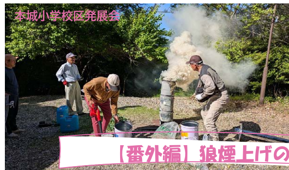
【番外編】狼煙上げの様子（蚕霊神社）

のろしあ 地域をつなぐ狼煙上げラリーは、今回は恵那市の各地方の方々の協力もあり、県境を越えて市場城▶蚕霊神社▶旭高原元気村▶大平城(恵那市串原)▶明知城▶岩村城へとつなぐことができました！