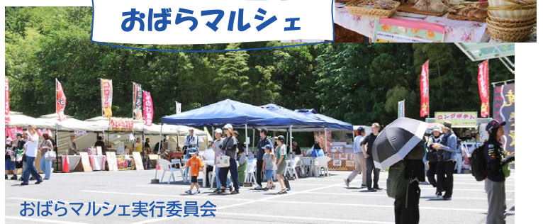
おばらマルシェ実行委員会