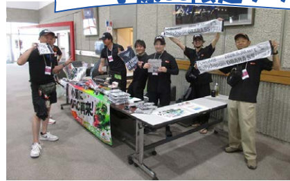
ラリージャパン公式グッズ・ 小原SS限定グッズ販売

おばらラリーをいかしたまちづくり実行委員会をはじめとする地域の有志が様々な企画でラリーを盛り上げました。遠くから小原を訪れる方も、小原在住の方も、一緒に楽しめる活気あふれる一日となりました。