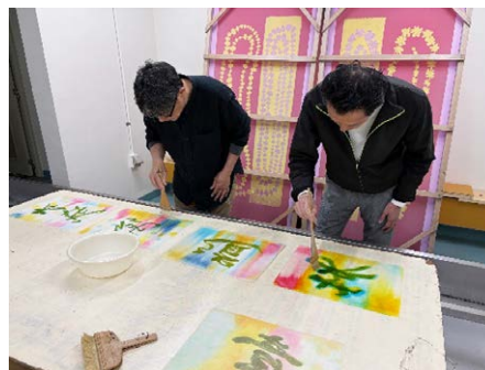
レクチャーの様子

自分ですいた卒業証書は、地域の誇りとしてこども達の宝となり心に残ることでしょう。