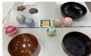
作品に触ることができました!