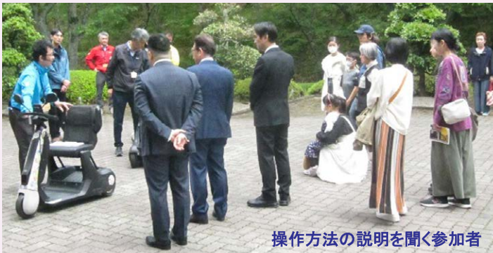
操作方法の説明を聞く参加者