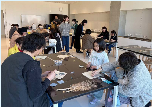
ワークショップの様子(3月8日)