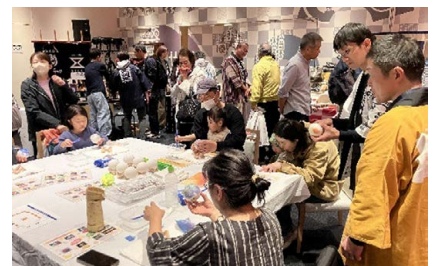
日本の手仕事市の様子

2月28日(土)に東京の神田明神文化交流館で開催された日本の手仕事市に参加しました。多くの方に豊田小原和紙の魅力を伝えられました。特にまんまるライトワークショップが大好評でした。