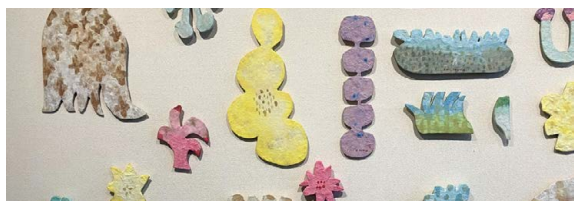
▲令和7年度展覧会の様子