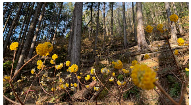
【ところ】市場町松ヶ田…神明神社(李町)から本城小学校(市場町)へ向かう道の途中、右手

わくわく事業としての活動は7年目を迎え、この春、黄金郷が満開に！ミツマタの小さな黄色い花がキラキラと輝くように山を照らします。事業開始当初に植えた山の上の方のミツマタは特に立派に育っています。遊歩道にはお手製の階段があり、ミツマタ畑の間を歩いて斜面を登ることができます。中腹辺りはこれから更に植樹をし、今年はベンチもできる予定です。現在進行形で整備を進めていますが、既に散策いただけます。ぜひ香りも楽しみながら歩いてみてください。