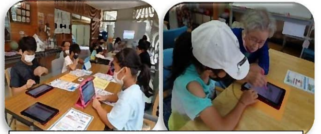
多世代交流事業（タブレット教室の様子）

顔の見える・気軽に相談できる関係を今年度も築いていきます。よろしく願いいたします。