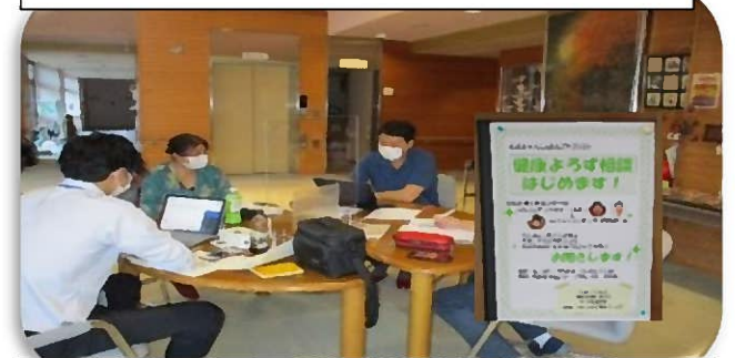
福祉・医療連携事業（健康よろず相談の様子）