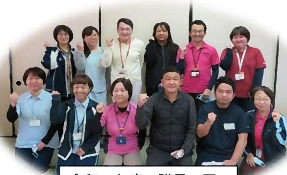
令和4年度 職員一同