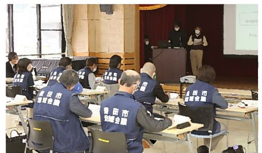
わくわく事業審査会の様子

今後、わくわく事業の活動の様子や案内など支所だよりでも紹介していきますので、是非ご注目ください。