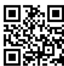
豊田おいでんまつり公式 HP