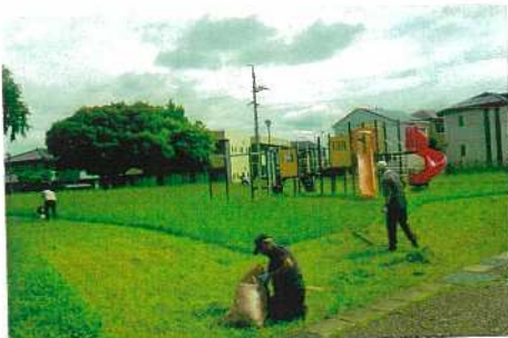
若林自治区協力、遊具付近の草刈り(7年6月)