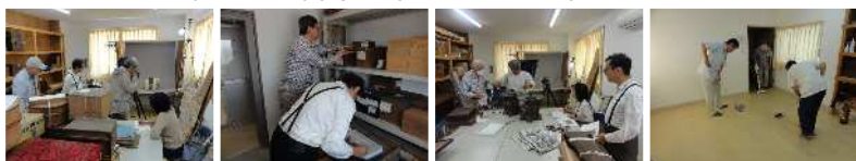
[文化財の写真撮影] [文化財の台帳照合] [文化財の追加記録] [清掃]