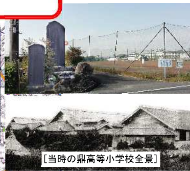
[当時の県高等小学校全景]

No. 8 獅子屋形<雨乞神輿> ・若林駅から北へ、徒歩 10 分(700m) ・若林八幡宮拝殿の東側