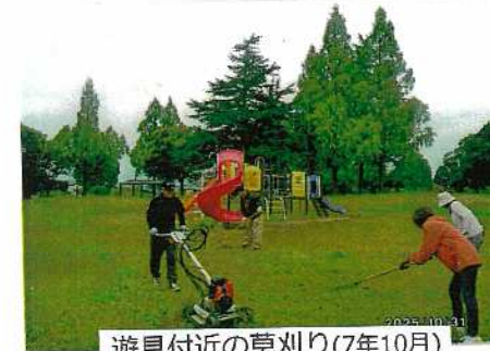
遊具付近の草刈り(7年10月)