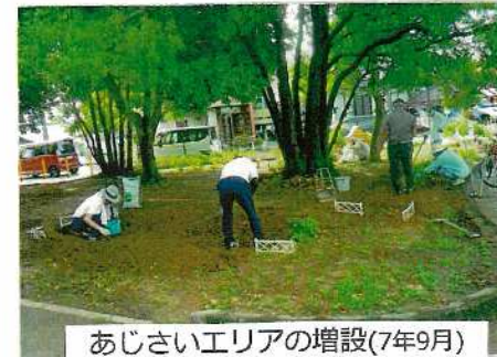
あじさいエリアの増設(7年9月)