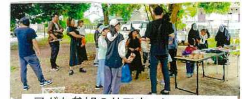
子ども参加のハロウィン(7年10月)