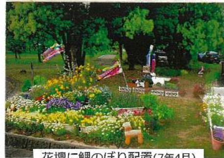
花壇に鯉のぼり配置(7年4月)