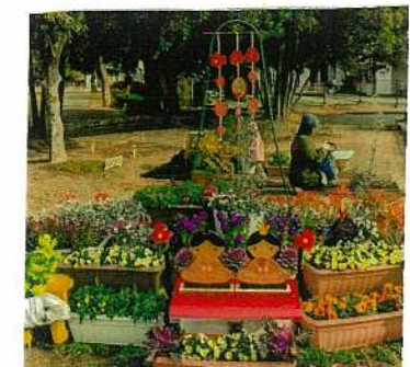
冬花壇にひな飾り(8年2月)