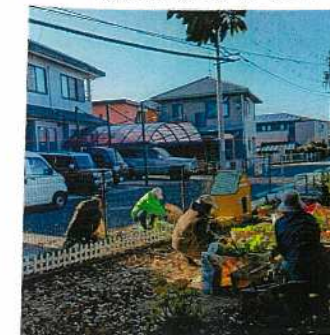
道路・花壇の落ち葉回収(7年12月)