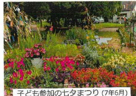
子ども参加の七夕まつり(7年6月)