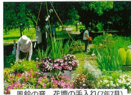
風鈴の音、花壇の手入れ(7年7月)