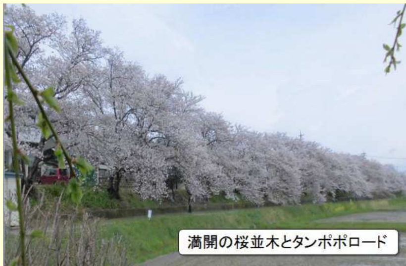
満開の桜並木とタンポポロード