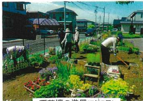
夏花壇の準備(7年5月)