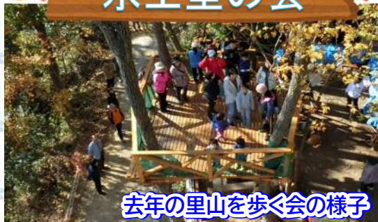
去年の里山を歩く会の様子

桂野町の里山散策路整備や椎茸原木の切り出し、菌打ち、孟宗竹で灯籠作りなど多くの活動をしています。日頃の活動を報告するために11月22日(日)8:30～『秋の里山を歩く会』を開催します。