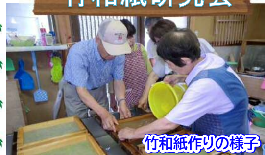
竹和紙作りの様子

松平地区の地域資源「竹」を生かした和紙づくりと文化の継承をねらい、竹和紙のPRを行っています。竹和紙の特色をさらに生み出すために竹和紙商品の作成や紙すき体験を通じて竹和紙の魅力を多くの人に伝えています。