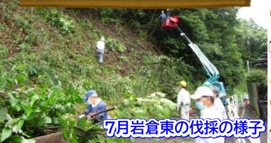
7月岩倉東の伐採の様子

通学路沿いの危険な樹木や車両の通行を妨げる樹木の伐採を自治区民と協力して行っています。