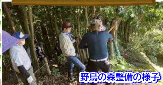
野鳥の森整備の様子

滝っ子まつりが新型コロナウイルスの影響で中止になってしまった分、野鳥の森整備に尽力し、地域と小学校のつながりを大切にしています。