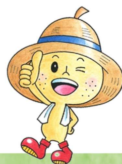
上郷地区キャラクター『ゴウ君』