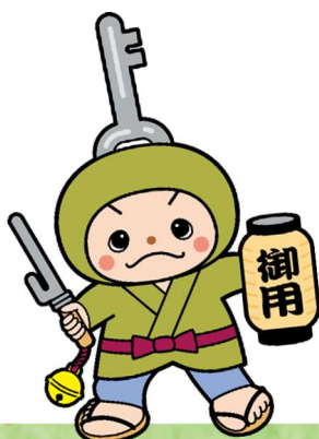
末野原地区 防犯キャラクター『かけりん』

E-mail：kamigou-shisho@city.toyota.aichi.jp