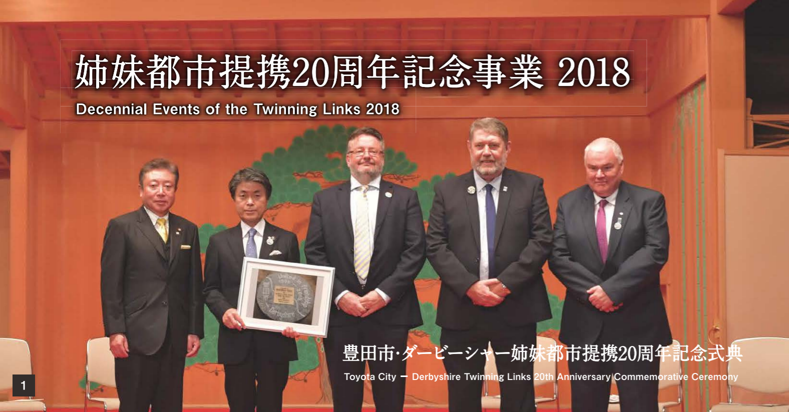
1 豊田市・ダービーシャー姉妹都市提携20周年記念式典 Toyota City - Derbyshire Twinning Links 20th Anniversary Commemorative Ceremony

Decennial Events of the Twinning Links 2018