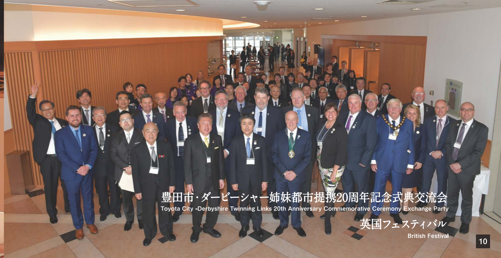
10 豊田市・ダービーシャー姉妹都市提携20周年記念式典交流会 Toyota City - Derbyshire Twinning Links 20th Anniversary Commemorative Ceremony Exchange Party 英国フェスティバル British Festival

1 ダービーシャー3地域からの記念品贈呈 Commemorative gift presented from Derbyshire County, City of Derby and South Derbyshire District.