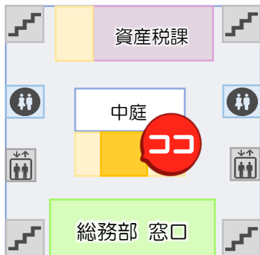
南庁舎 3F MAP