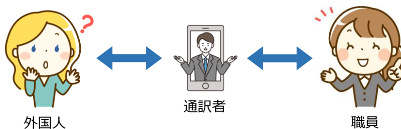
(映像通訳イメージ)

※映像通訳サービスは令和元年9月6日に開設された「多言語サービスデスク」でのみ利用 開設は市民相談課、上郷支所、猿投支所、高岡支所、高橋支所及び保見出張所の各窓口