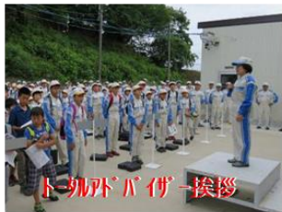
トヨタバザー挨拶

120名の参加者を迎え、指導員、スタッフ、保護者全員で盛大に開催。これからの活動への決意を誓い合いました。