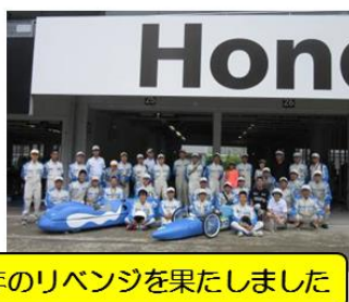
2台とも見事に完走し昨年のリベンジを果たしました