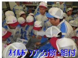
材料ソフ分解・組付