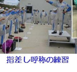
指差し呼称の練習