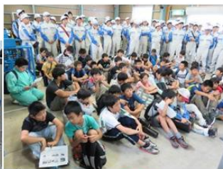
コース別のオリエンテーション