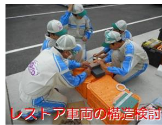
レストア車両の構造検討