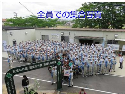
全員での集合写真