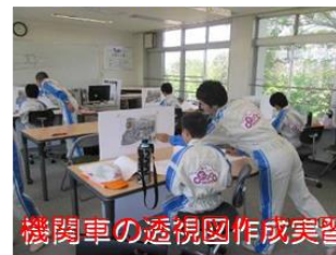
機関車の透視図作成実習