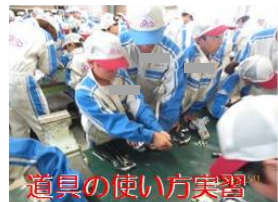
道具の使い方実習