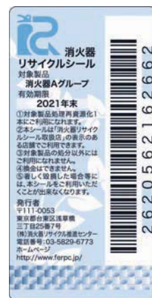
新製品用消火器 リサイクルシール 有効期限 10年