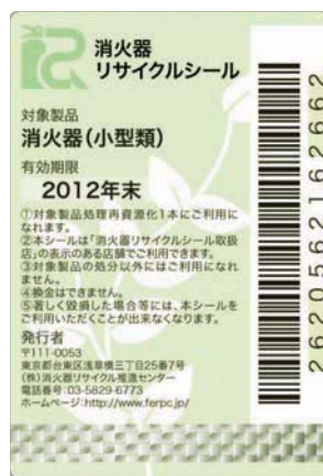
既製品用消火器 リサイクルシール 有効期限 2年

(注2) 排出場所から特定窓口または指定引取場所までの運搬については、別途費用がかかります。