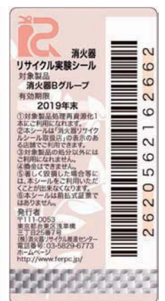
社会実用消火器 リサイクルシール 有効期限 10年 (2010年製造分のみ)