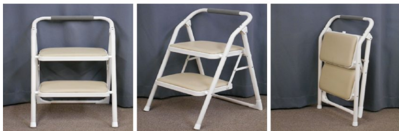
脚立(2段、折りた たみ式)