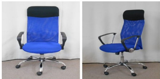
イス(回転式、キャスター付)