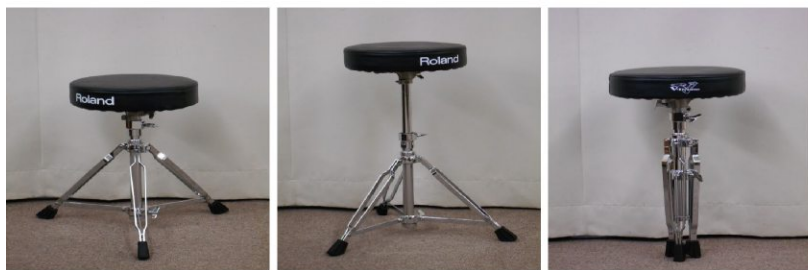
イス(折りたたみ式)