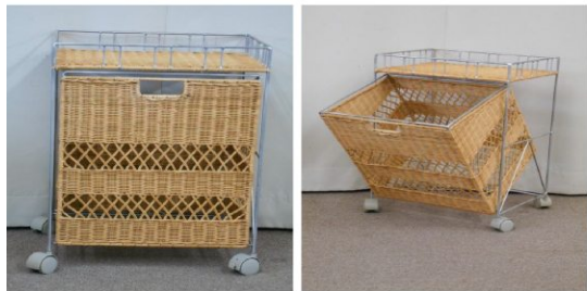
ランドリーボックス (キャスター付)