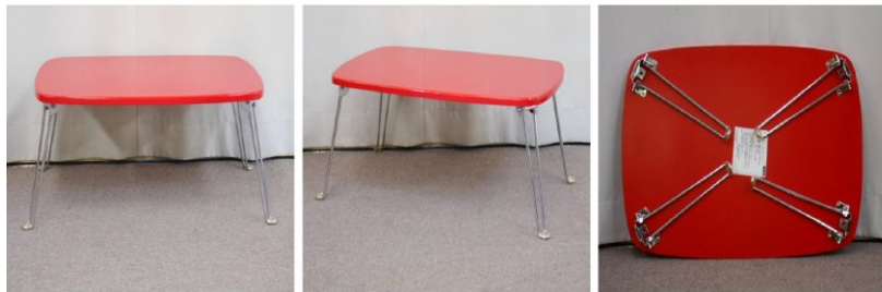
テーブル（折りたたみ式）