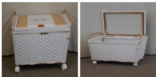
物入れ(キャスター付)