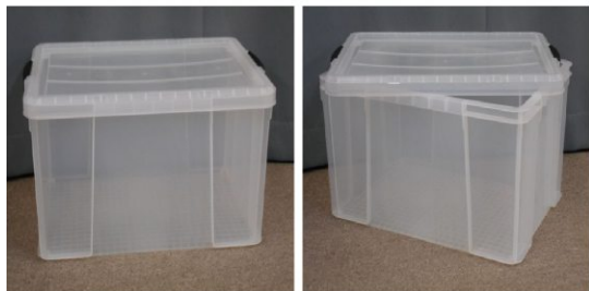
ふた付収納ケース