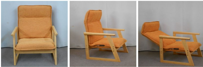
イス(リクライニング式)