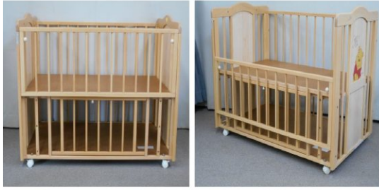
ベビーベッド(キャスター付)