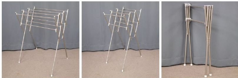
物干し(折りたたみ式)