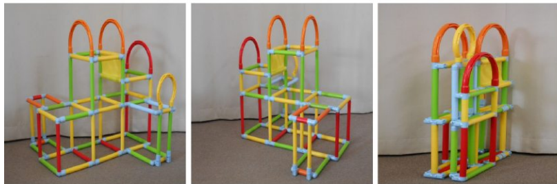
ジャングルジム(折 りたたみ式)