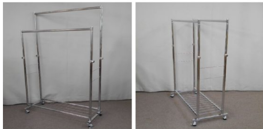
洋服掛け(キャスター付)