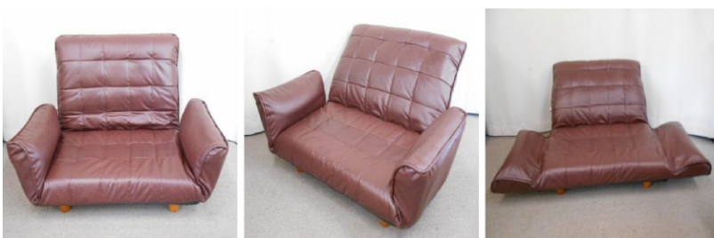
ローソファ（2人掛け）

20. ローソファ（2人掛け） 最低入札価格 300円 【落札価格】 5,000円 【入札件数】 7