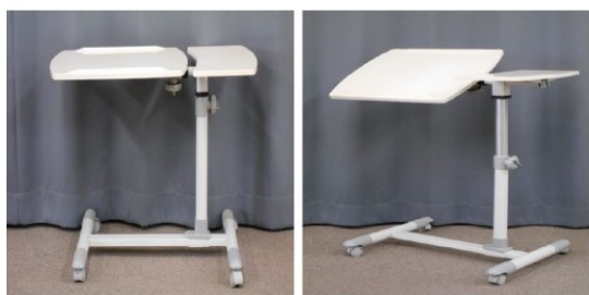
テーブル(キャスター付)