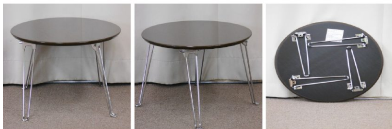
丸テーブル(折りたたみ式)