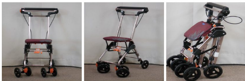
シルバーカー（折りたたみ式）