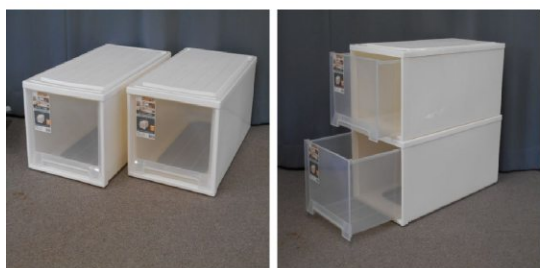
引出し式収納ケー ス2個セット