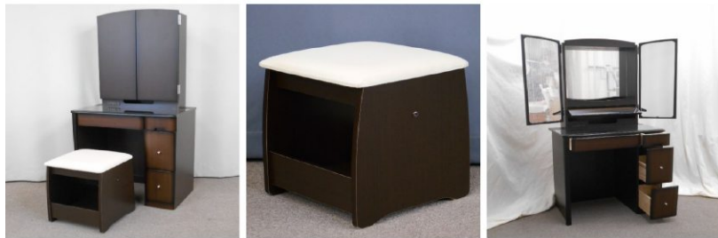
ドレッサー(コンセント付) イス