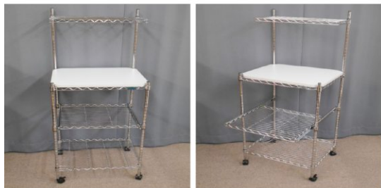
キッチンラック(4段、キャスター付)