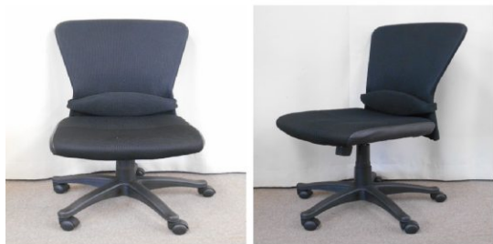
イス(回転式、キャスター付)