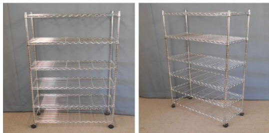
メタルラック(6段、 キャスター付)