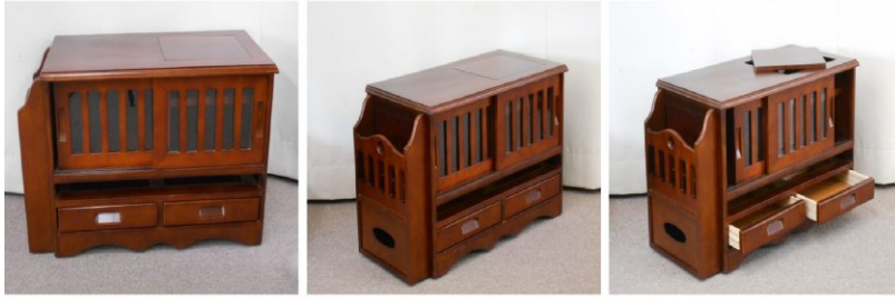
物入れ(キャスター付)