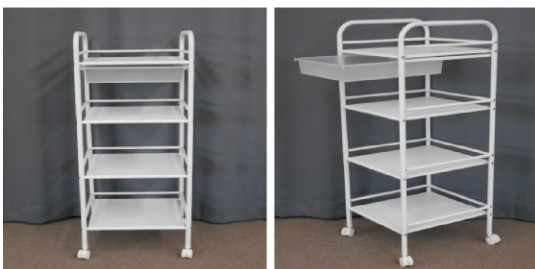
棚(4段、キャスター付)