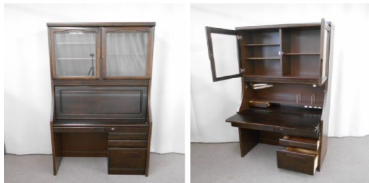
ライティングデスク (コンセント付)