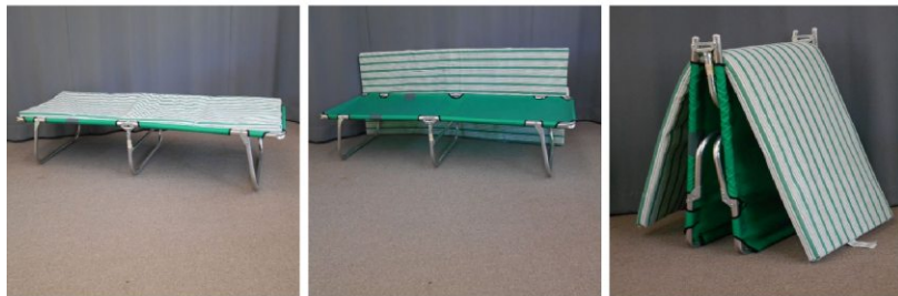
簡易ベッド(折りたたみ式)