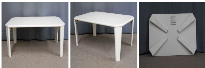
テーブル(折りた たみ式)