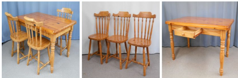
ダイニングテーブル イス3脚セット