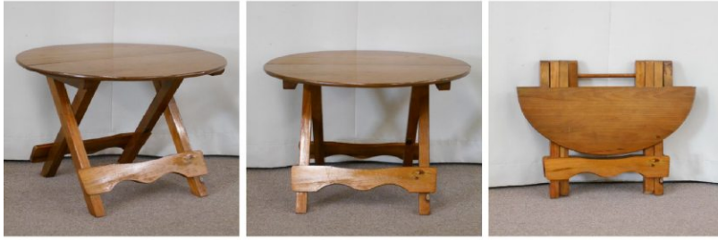
丸テーブル(折りたたみ式)