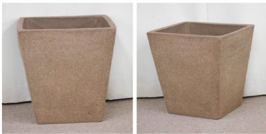
プランター(焼き物)