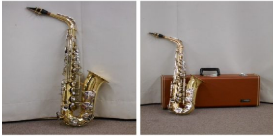
アルトサククス ケース