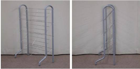
シューズラック(4段)