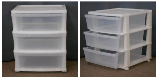
クリアケース(3段、 キャスター付)