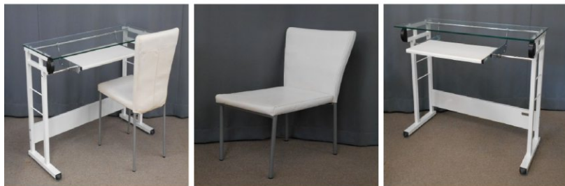
パソコンデスク イス