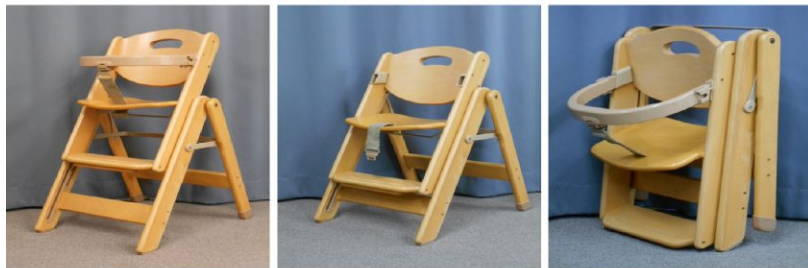
ベビーチェア (折りたたみ式)