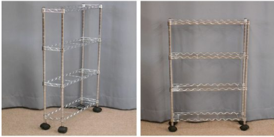
スリムメタルラック (4段、キャスター付)