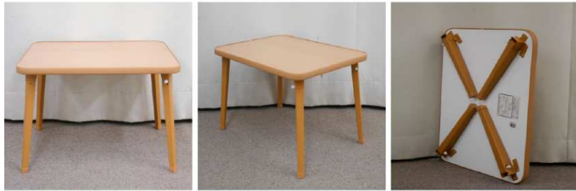
テーブル(折りたたみ式)