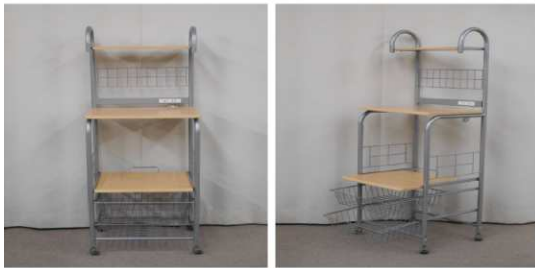
キッチンラック(コンセント、キャスター付)