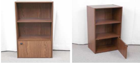
カラーボックス(3 段)