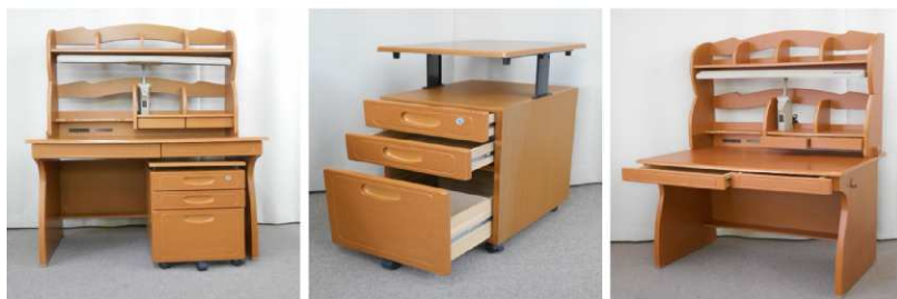
学習机(コンセント付) 袖机(3段、キャスター付)