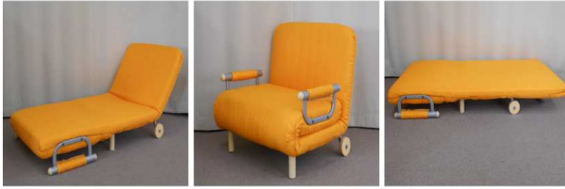
ソファベッド(キャスター付)