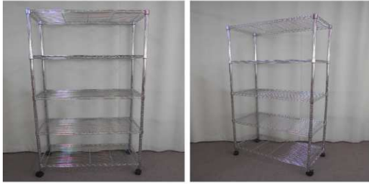
メタルラック(5段、キャスター付)