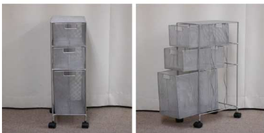
ラック(3段、キャス ター付)