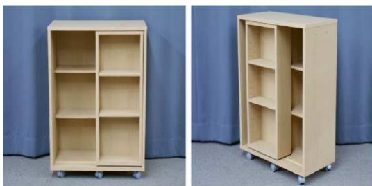
棚（3段、キャス ター付）