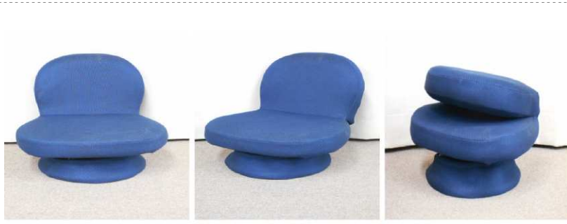
座イス(回転式、折りたたみ式)