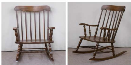
ロッキングチェア