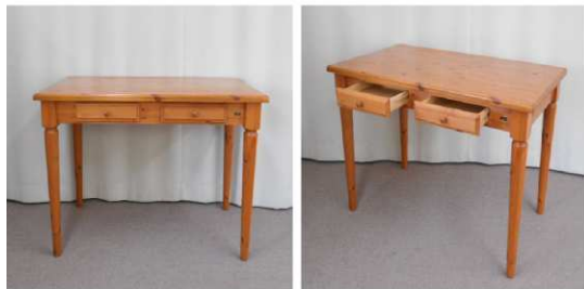
ダイニングテーブル