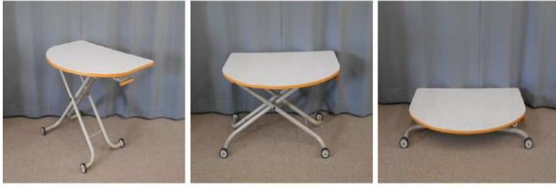
昇降式テーブル （折りたたみ式、 キャスター付）