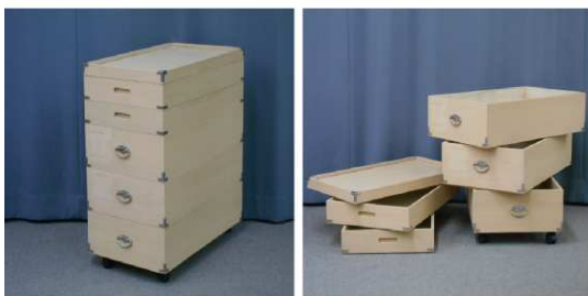
衣装箱(5段、キャスター付)