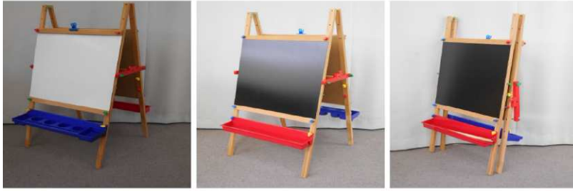
お絵描きボード (折りたたみ式)