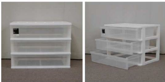
引出し式収納ケー ス(3段)