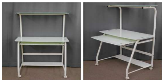
パソコンデスク (キャスター付)