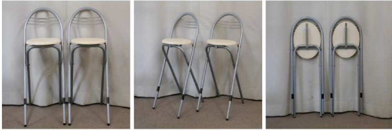
イス2脚セット(折りたたみ式)