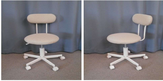
イス（回転式、キャスター付）