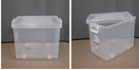
ふた付収納ケース (キャスター付)