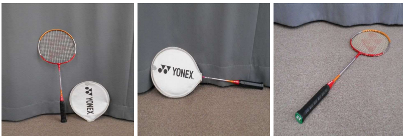
ラケット (カバー付)