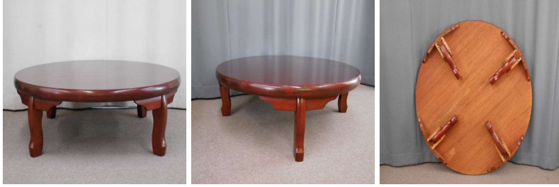
丸座卓（折りたたみ式）