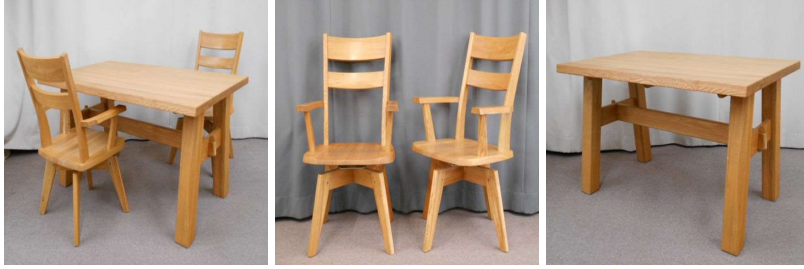
ダイニングテーブル