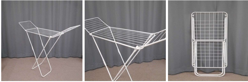
物干し(折りたたみ式)