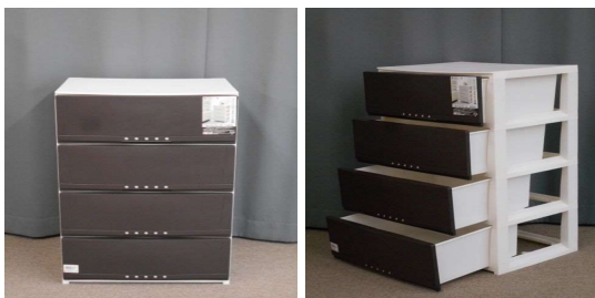
引出し式収納ケース(4段)