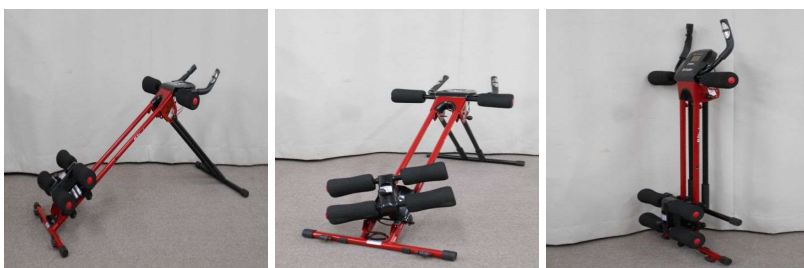
健康器具（折りたたみ式）