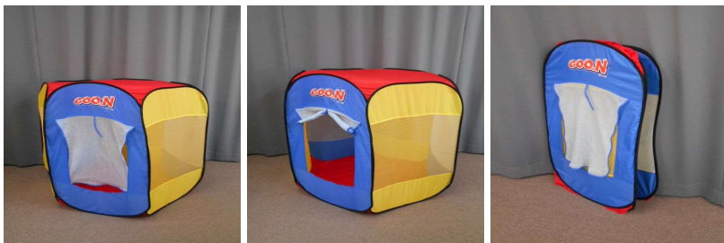
子ども用テント(折りたたみ式)