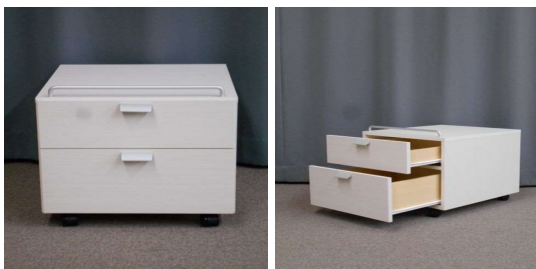
チェスト(2段、キャスター付)