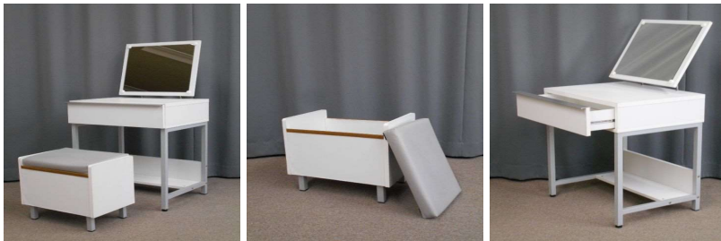
ドレッサー イス(収納付)