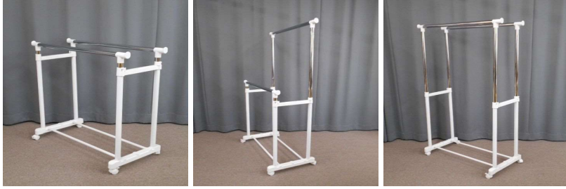
洋服掛け(キャスター付)