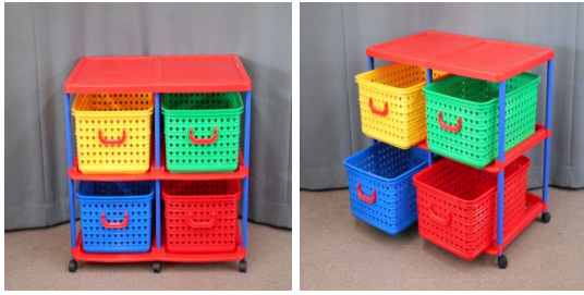
ラック(2段、キャスター付)