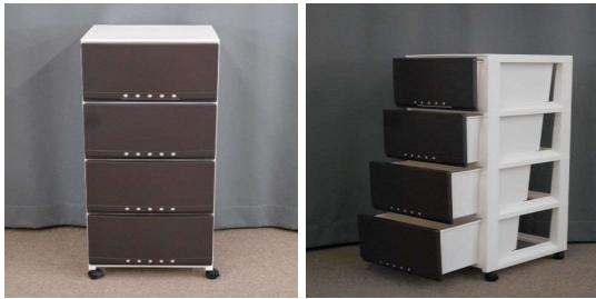
引出し式収納ケース(4段、キャスター付)