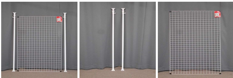
メッシュパネル 突っ張り棒2本セット