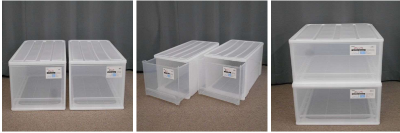
引出し式収納ケース2個セット