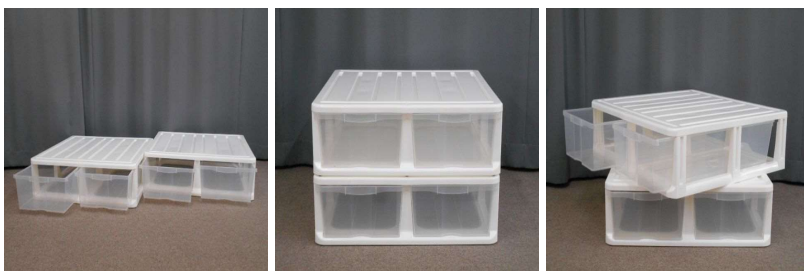
引出し式収納ケース2個セット