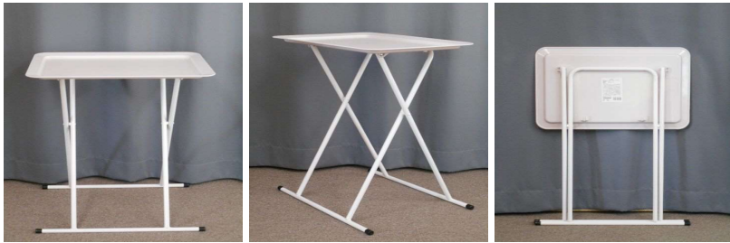
テーブル(折りたたみ式)