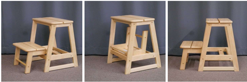
踏み台（折りたたみ式）