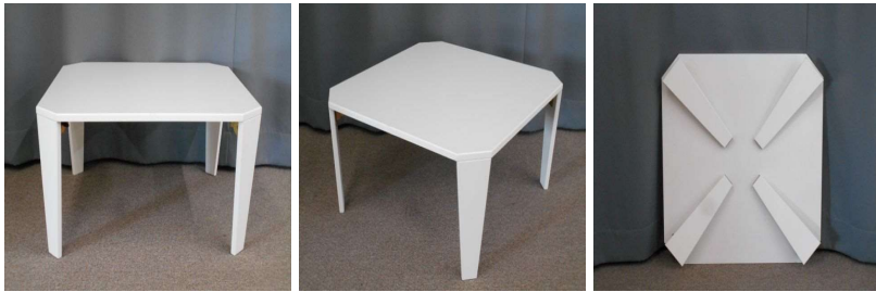
ローテーブル(折りたたみ式)