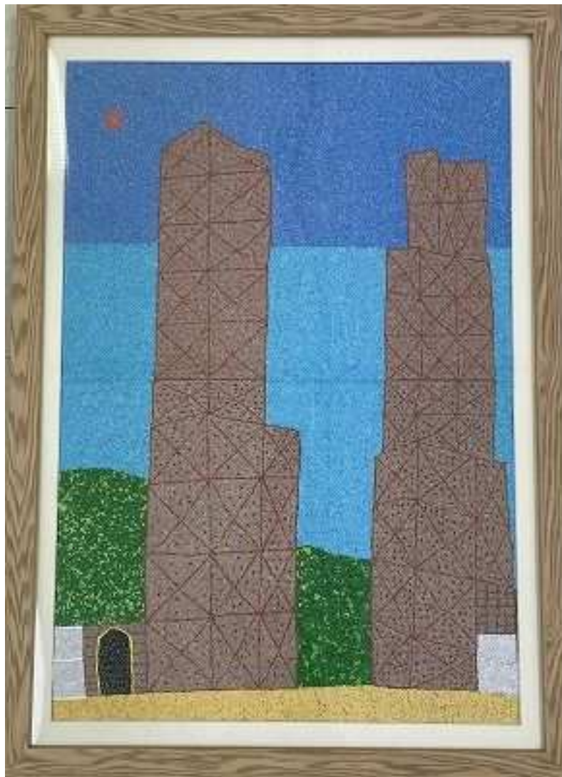
『葦山反射炉』 田原 俊