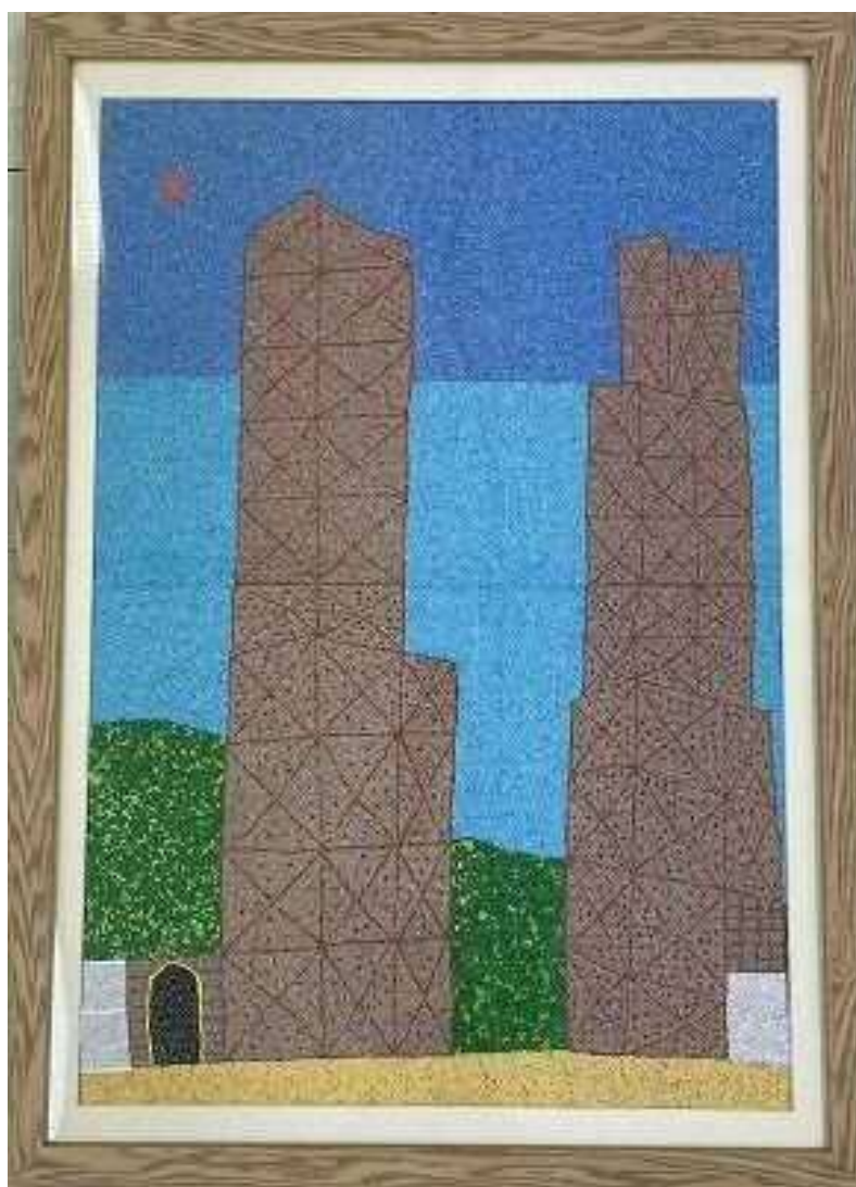
『葦山反射炉』 田原 俊