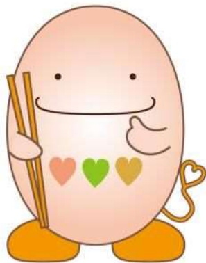
豊田市食育キャラクター たべまる