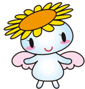
健康づくりキャラクター きらちゃん