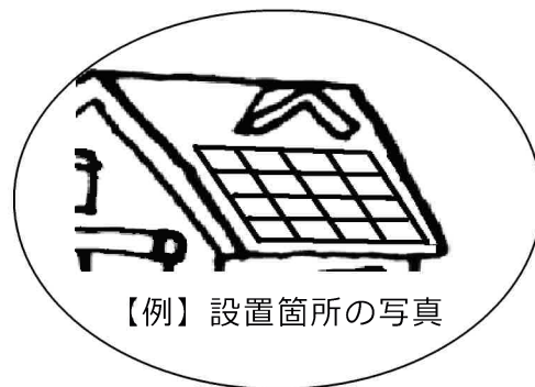
【例】設置箇所の写真

こちらへ写真を貼付して下さい。この部分に画像を貼付して印刷し、ご提出していただいても構いません。