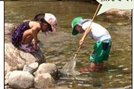
写真：(上)五平餅づくり体験、(下)川遊び体験