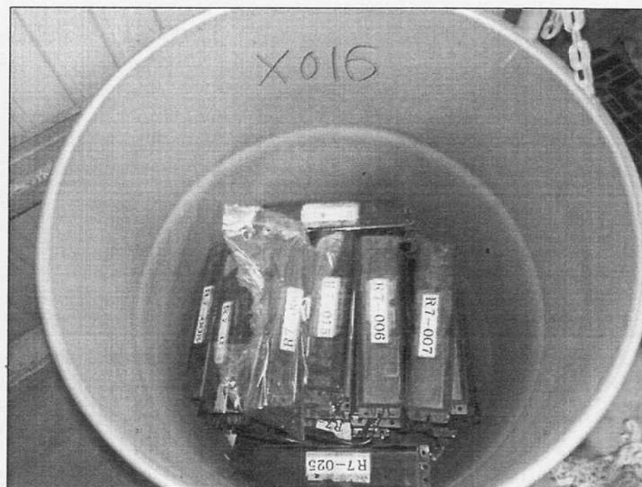
ドラム缶内部状況