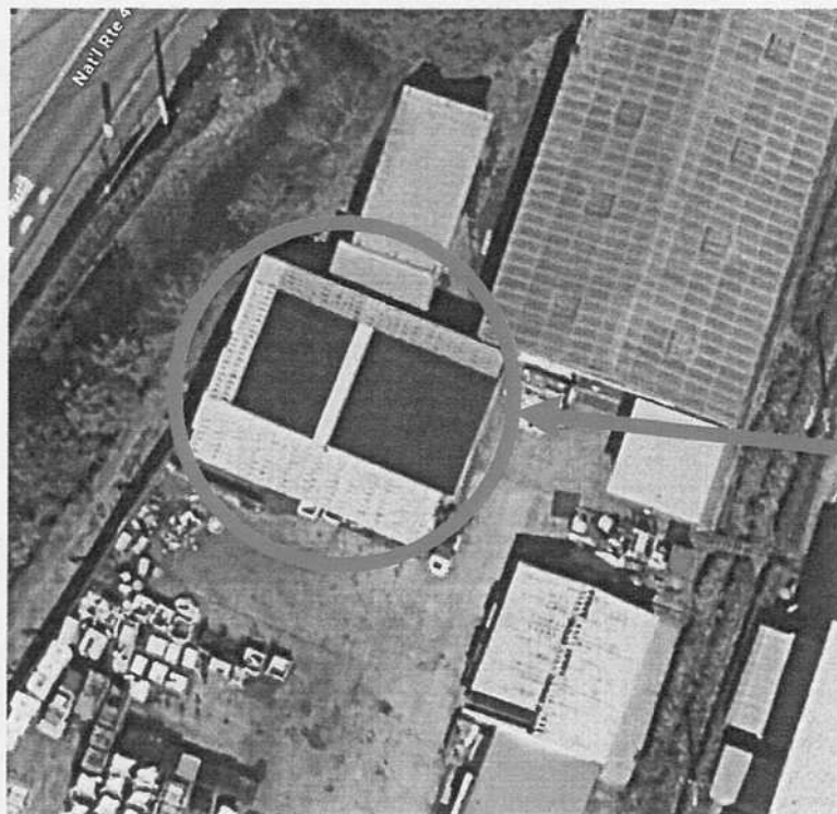
P C B 保管倉庫