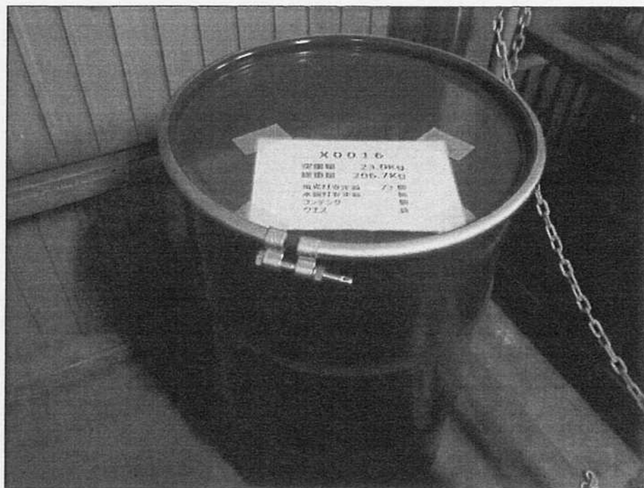
ドラム缶保管状況