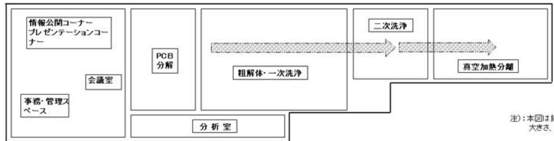
2 階 平 面

注：本図は施設レイアウトの構想図です。実際の設計時点で位置、大きさ、形状などが変更することがあります。