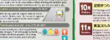
城津公園足助城 Parque das Flores da Colônia de Asuke