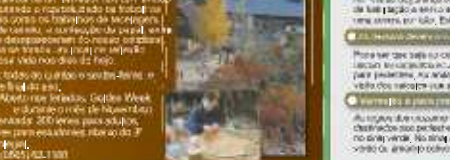
香積寺 Templo Kōkaiji