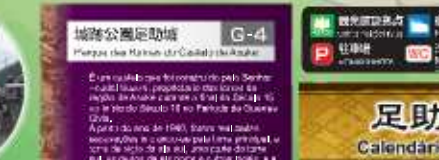
城津公園足助城 Parque das Flores da Colônia de Asuke