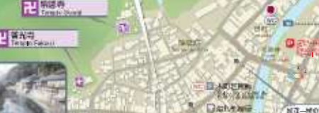
足助中馬産 Asuke Chūmaban