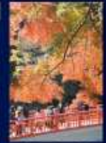
曹洞坊のライトアップ

Situa-se no centro de Asuke, o templo Kōrankei foi reconstruído no verão de 1923, após um incêndio que destruiu o antigo templo. O templo é conhecido por suas vistas variadas, desde o jardim até o jardim retratado no rio. As flores de sakaki anunciam a chegada da Primavera, o verde novo sinaliza o início do verão, e a referência ao templo é encontrada no jardim de inverno e no jardim de inverno das árvores que formam o Rio Tenno. No Outono as folhas vermelhas de um arbusto vistoso, e a vista relaxante viva, colhe as aparências do rio, revelando uma beleza que até parecia ser da arte.