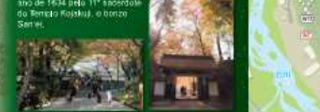
香積寺 Templo Kōkaiji