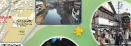
足助の町並み Asukas no Asuke