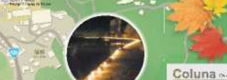
足助中馬産 Asuke Chūmaban