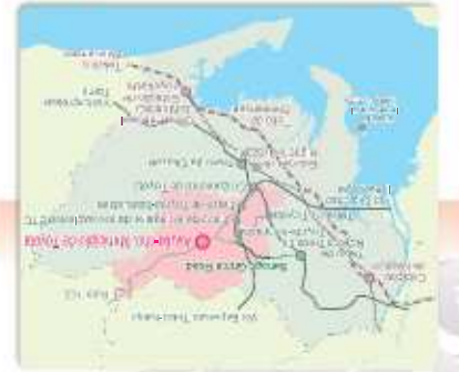
Principais Estações e Rotas de Acesso

Comitê Associação de Comerciantes e Produtores de Asuka Associação de Comerciantes e Produtores de Asuka Associação de Comerciantes e Produtores de Asuka Associação de Comerciantes e Produtores de Asuka Associação de Comerciantes e Produtores de Asuka De Trem ou Ônibus Estação: Estação de Asuka Estação: Estação de Asuka Estação: Estação de Asuka Estação: Estação de Asuka