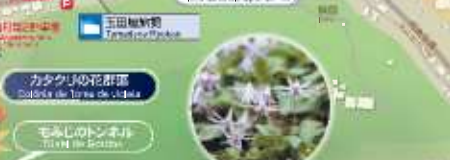
カタクリの花群像 Colônia de flores de violeta