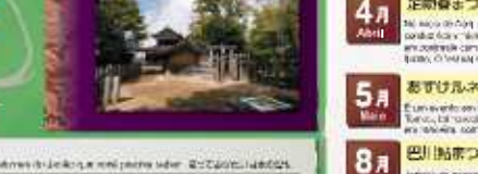
城津公園足助城 Parque das Flores da Colônia de Asuke