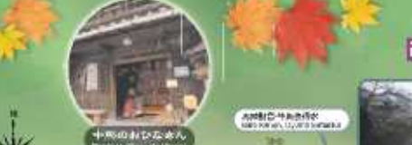
中馬のおひなさん Bonesse Ōhina de Chūma