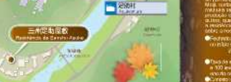
香積寺 Templo Kōkaiji