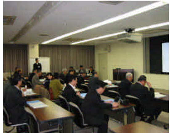
施設概要説明の様子