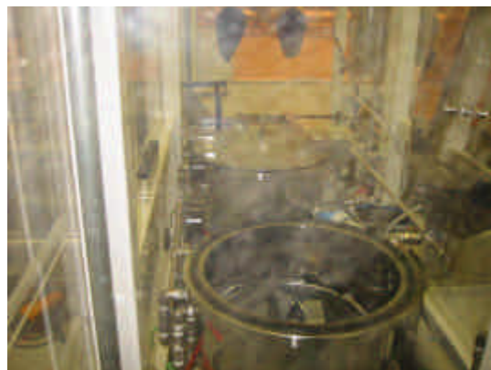
真空超音波洗浄工程