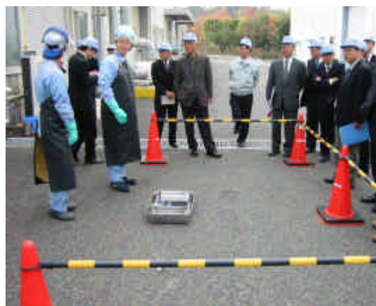
S D安全性試験の様子