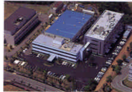
株式会社神鋼環境ソリューション 技術研究所