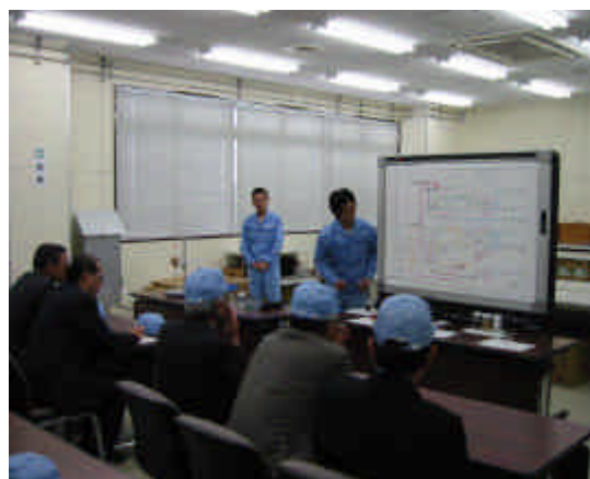
分析に関する説明