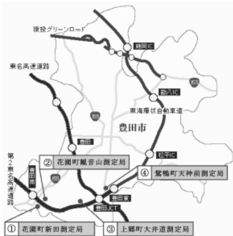
図 28 大気測定地点