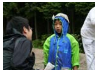
記者の取材も受けちゃった！