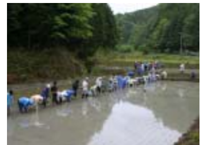
約100名の参加者が集まりました

当日は機械に頼らず、参加者が手作業で作業に取り組みました。小雨の降るあいにくの天候となりましたが、腰の痛みと戦いながら参加者は熱心に取り組んでいました。