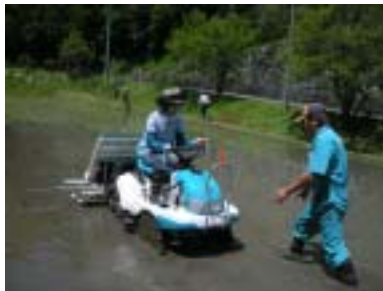
講師の指導もあり、無事乗りこなしました