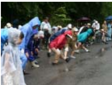
準備運動だってバッチリ