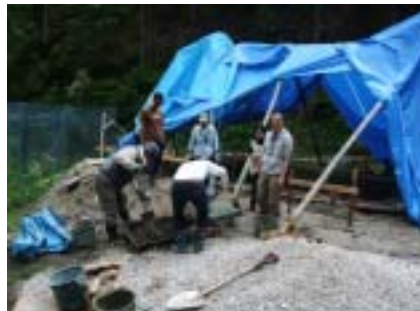
もうヘトヘトです、..