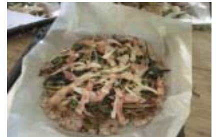
ごぼうをのせたライスピザ