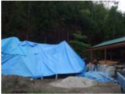
3メートルは高さのある大きな屋根

29日には、柱の基礎工事としてセメントを流し込む作業に取り組みました。水と砂利との配合比率が微妙で練り直すなど、慣れない作業に戸惑いながらも、予定された工程を達成しました。「筋肉痛がコワイ」との声多数、..みなさまお疲れ様でした。