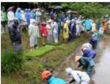
まずは先生がお手本です