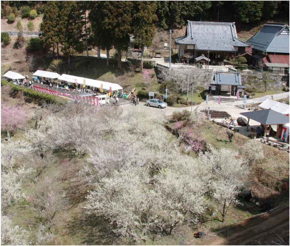
昨年の梅まつりの様子

旭地区の日下部町にある最光院一帯に見事な梅園があるのをご存じですか。標高約450mに位置する最光院。例年3月中旬になると、参道沿いの畑で約500本のウメが咲きます。このウメは、今から17年ほど前に、米の生産調整を機に植えられたもので、地元のかぶ元気クラブの農家が実を採取し、梅干しづくりをしています。同地区では梅の名所となっていますが、幹線道路から少し奥まった場所であり、数年前までは地元の人にしか知られていませんでした。 同梅園では3月20日(土)〜22日(月)に、「つくほの里梅まつり」が開催されます。和太鼓演奏や大正琴演奏、舞踊、腹話術などを日替わ