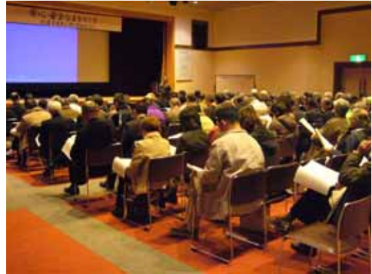
地域会議主催の防犯講演会(平成20年2月)

地域会議は、豊田市の審議機関で、市長から諮問された課題に対しての答申をはじめ、地域課題の解決のための意見や提案、わくわく事業の審査など、地域の発展のために重要な役割を担います。