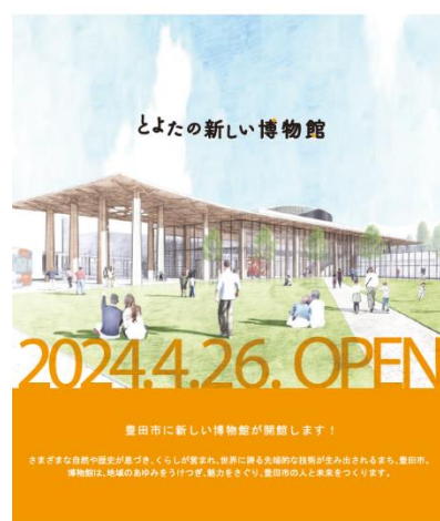
▲豊田市博物館パンフレット