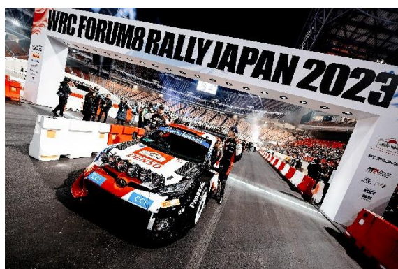
▲世界ラリー選手権