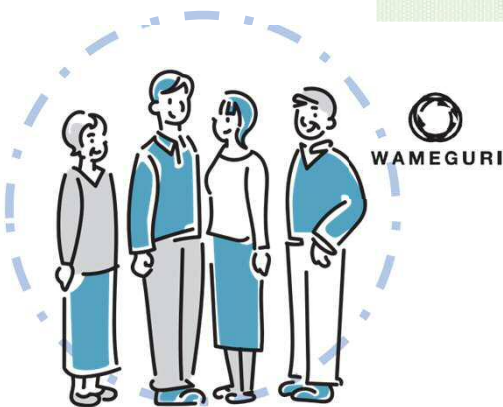
日常生活の中の衣類