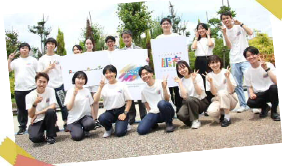
南山大学、中京大学、愛知工業大学、豊田工業高等専門学校等 多様な学生が携わっている。