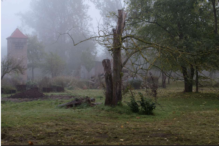
ヤン・ヴォー ギュルデンホーフ、2023年10月 Danh Vo, Güldenhof, October 2023