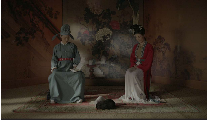
リウ・チュアン《リチウムの湖とポリフォニーの島II》2023年 Liu Chuang Lithium Lake and Island of Polyphony II 2023