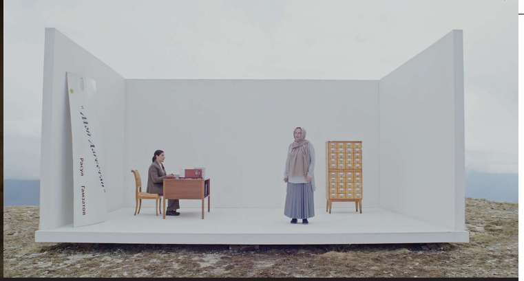
タウス・マハチェヴァ《Tsumikh (鷹にて)》2023年 Taus Makhacheva Tsumikh (Avar for "At the Eagle's") 2023