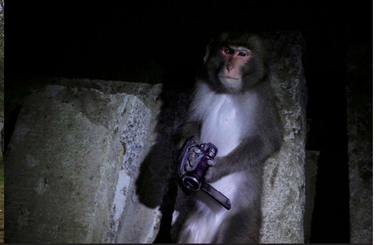
田村友一郎《Ars》2017年 Yuichiro Tamura Ars , 2017