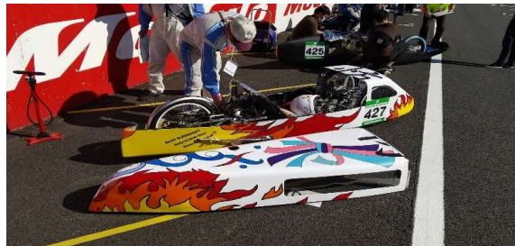
クルマづくり究めるプロジェクトONE号

動力 50ccガソリンエンジン 2.7kw(3.7PS) ボデー全長 2700mm 全幅 620mm 重量 52Kg 構造 鋼管フレーム+FRPボデー