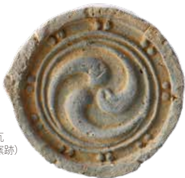
軒丸瓦 (塩狭間窯跡)