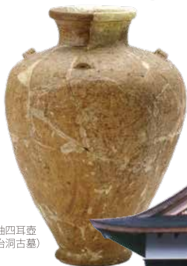
灰釉四耳壺 (平治洞古墓)