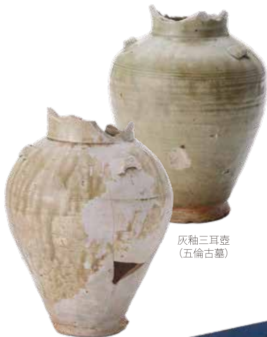
灰釉三耳壺 (五倫古墓)