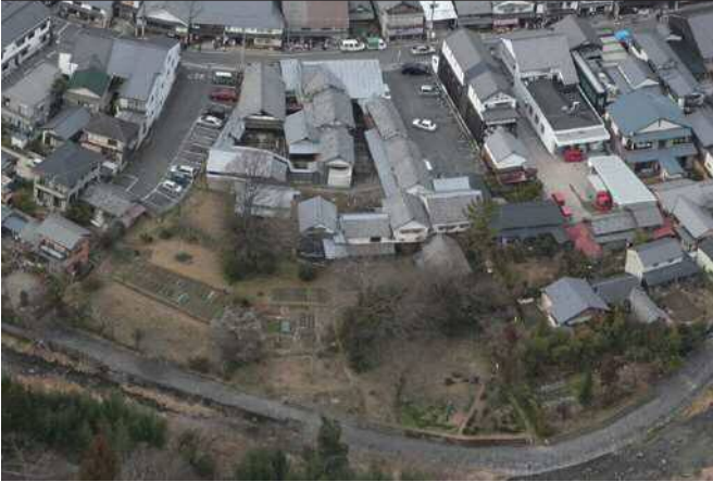
▲구 스즈키 가문 저택 전경