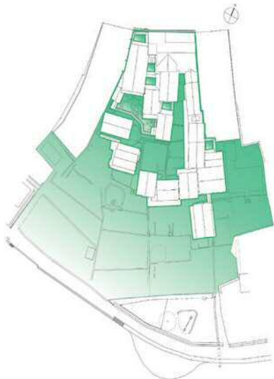
▲图: 铃木家故居宅邸范围