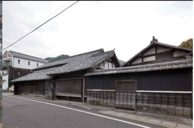
▲ Antiga residência da família Suzuki vista a partir da antiga estrada Ina