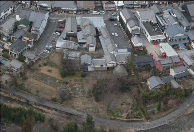
▲ Vista aérea da antiga residência da família Suzuki