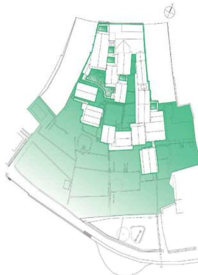
▲ Limites do local da antiga residência da família Suzuki

(incluindo 16 construções consideradas Patrimônios Culturais Importantes)