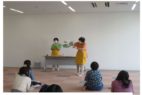
「事故予防の話」 豊田市保健センターにて