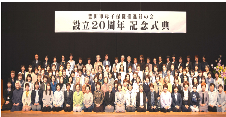
豊田市母子保健推進員の会 設立20周年 記念式典