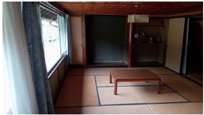
2 階南側和室 床の間