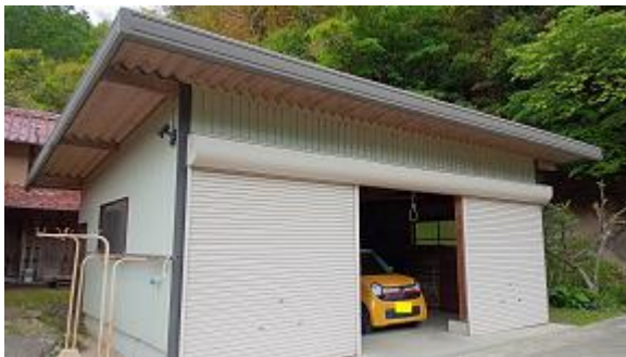
車庫（車 3 台駐車可）