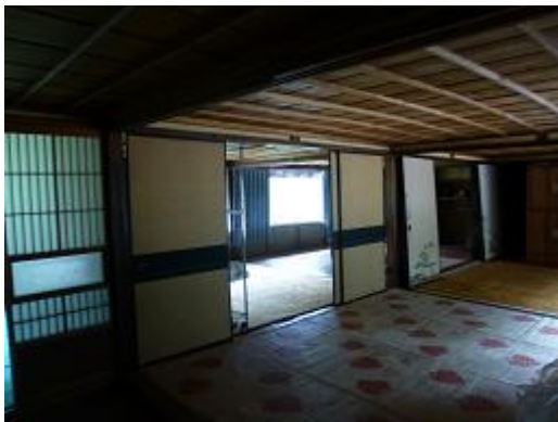
2 階北側和室 2 間