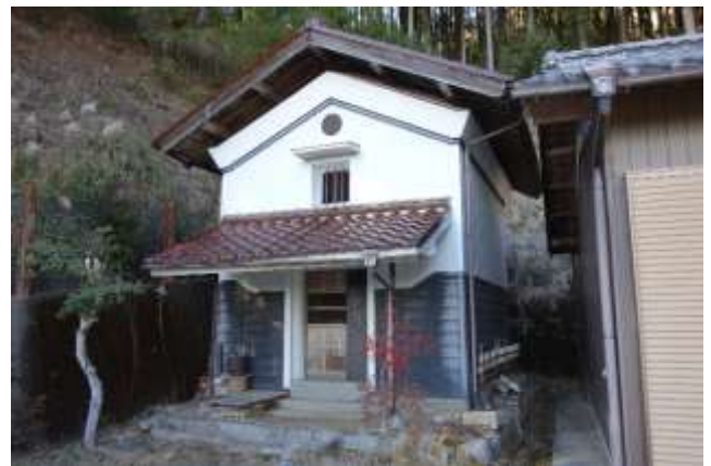
蔵 (使用可・残存物あり)