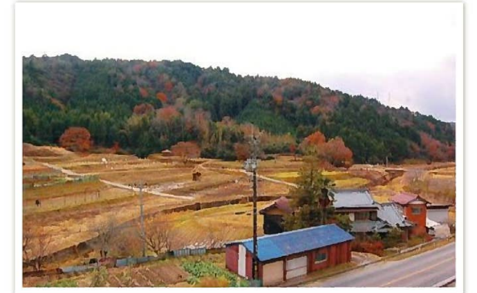
小原大坂町地内風景