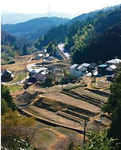
小原岩下町地内風景