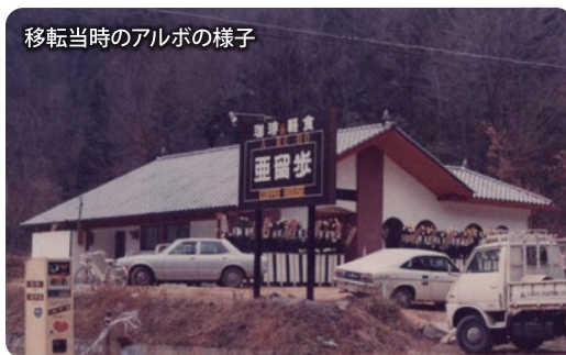
移転当時のアルポの様子

創業は昭和47年5月。当時マスターのお母様は子育て真っ最中。まだ幼かったマスターを抱っこしながら「子育て仲間と集まって話をしたいなあ」「お茶を飲みながら子供を遊ばせたいなあ」と思っていました。そんな時、目の前には草が生い茂っている庭を見て「人が集まれる場所を作らなくてはいけない」と思いました。家族に相談をしたところ、なんと祖父が1時間後にはその庭を草刈りしてくれられたそうです。そして、念願叶ってオープン。当初の店名は「喫茶岸」で、こじんまりとしていて、ちょうどしたコーヒーを出す程度のお茶屋さんだったそうです。しかし、その年の7月に、「47災害」が起きました。小原中学校が自