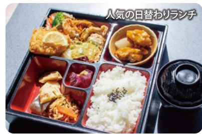
人気の日替わりランチ