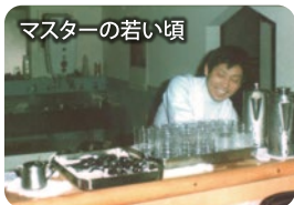
マスターの若い頃

衛隊の方たちの活動の場所に。「喫茶岸」では朝、昼、夜と休む暇もなく食事を提供し続けなければいけない大変な時期が続きまし。その後、今ある場所へ昭和52年に移転しました。こだわりのコーヒー・アルポオリジナルブレンドは、多少の改良があるものの、創業当時から変わらず、苦みと酸味、香り、温度のバランスを大事にしています。1日10食限定の日替わりランチは大人気。メニューも食事、ドリンク、デザート合わせて全90種類と豊富です。 ゆつたりと落ち着ける「喫茶アルポ」では是非、おくつろぎください。 豊田市永太郎町常寒248 午前8時〜午後6時「火曜定休」 電話0565-651651-3162