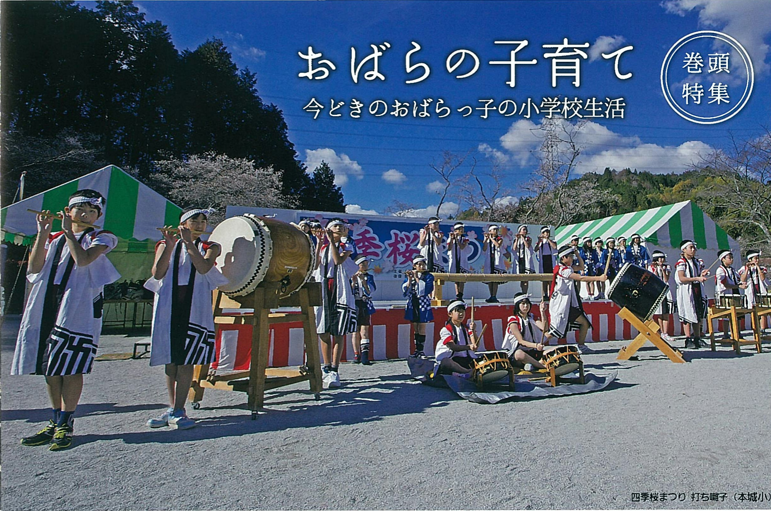
四季桜まつり 打ち囃子 (本城小)