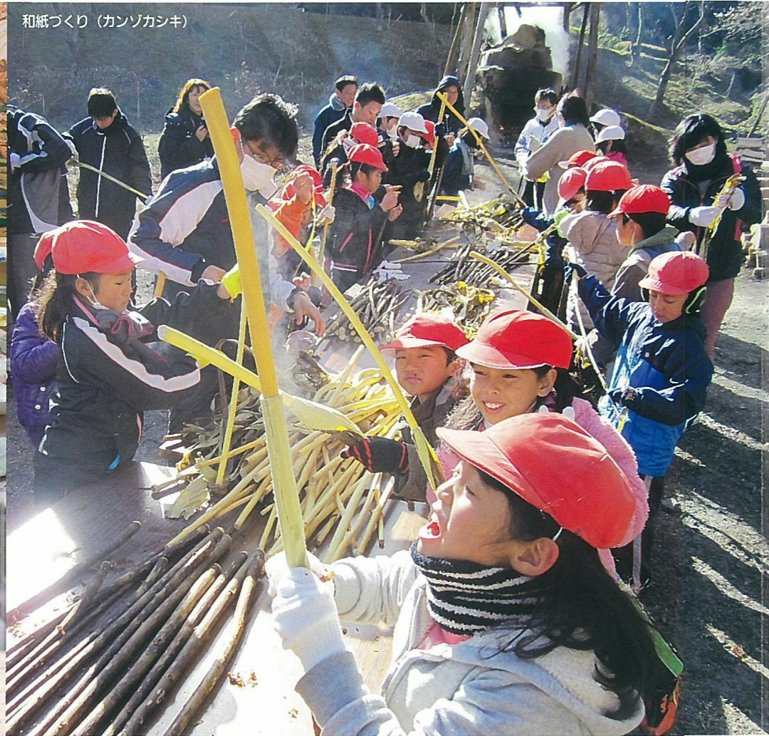
和紙づくり (カンソカシキ)