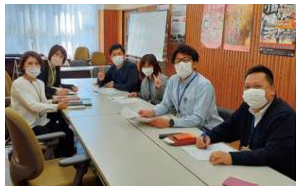
【支所・包括・社協の打合せの様子】

社会福祉協議会（以下、社協）と地域包括支援センター（以下、包括）が中心となり、足助の福祉を支える多くの人たちと一体となって、誰もがその人らしく暮らすことのできるように地域みなさんと一緒に考えていきます！