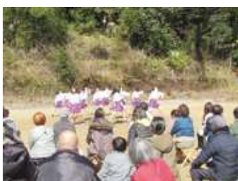
令和5年2月 プレオープン