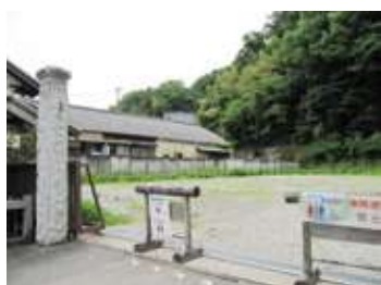
令和4年6月 整備前（砂利敷き）