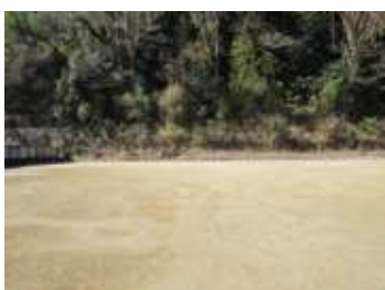
令和5年2月 第1期整備（砂敷き）

足助陣屋（江戸時代の役所）、伊那県足助庁、旧足助町役場、愛知県東加茂事務所などの歴史を持つ足助町の中心部にあるこの跡地は、多目的に活用しづらい砂利敷きの空き地となっていました。