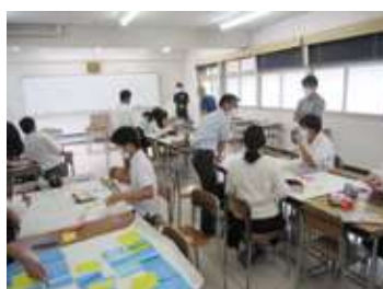
足助高校との利活用検討グループワーク

今回、住民と一体となって、子どもの遊び場、地域行事の活動拠点、重伝建など地域魅力の発信、災害時の一時避難場所など、地域に愛着を持って活用される拠点づくりを推進していきます。