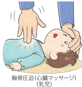
胸骨圧迫(心臓マッサージ) (乳児)

■ 乳児の場合: 左右の乳頭を結んだ線の中央で少し足側を、指2本で押します(右図)。