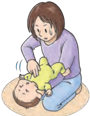
図4: 胸部突き上げ法 (乳児)