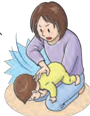
図3: 背部叩打法 (乳児)

片手で体を支え、手の平で後頭部をしっかり支えます。心肺蘇生法の胸部圧迫と同じやり方で圧迫しましょう(図4)。