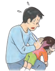
図1: 背部叩打法 (幼児)

幼児にはこどもの後ろから片手を脇の下に入れて、胸と下あご部分を支えて突き出し、あごをそらせます。片手の付け根で両側の肩甲骨の間を強く迅速に叩きます(図1)。乳児には片腕にうつぶせに乗せ顔を支えて、頭を低くして、背中の中を平手で何度も連続して叩きます(図3)。