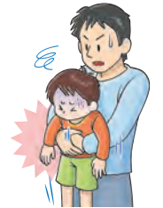
図2: 腹部突き上げ法 (幼児)